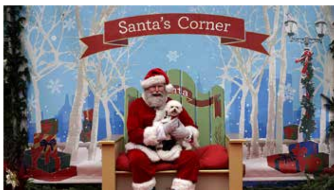
Mikołaj w Bryant Park

Doskonałym wzorcem do naśladowania jest słynny Bryant Park w Nowym Jorku, będący jedną z pierwszych realizacji stosujących się do zasad Palcema-kingu. W parku tym przez cały rok odbywają się wydarzenia o różnorodnym charakterze, dostosowane jednocześnie do pór roku i świąt. Tak np. w święta Bożego Narodzenia w parku można zorganizować świąteczny piknik z Mikołajem, loterią fantową, przy akompaniamencie kolęd.