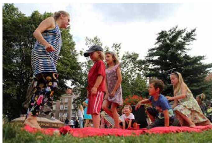
Joga dla dzieci w Parku Świętopelka