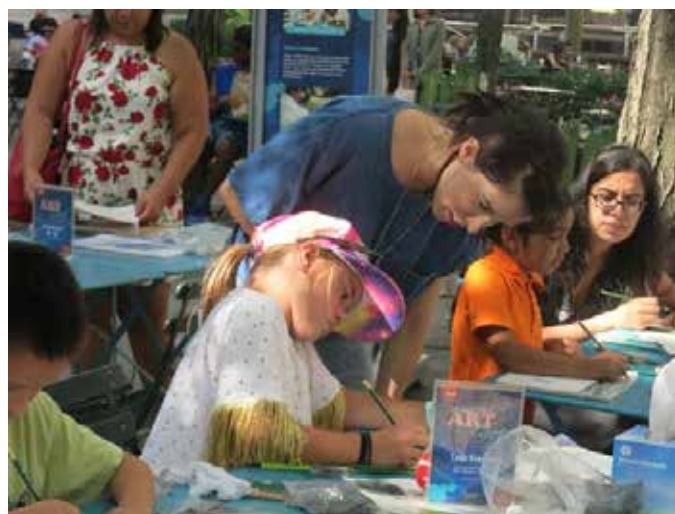
Kącik twórczy w Bryant Park, źródło: fb.com/bryantparknyc

Istotnym elementem kształtowania miejsca jest aktywizacja dzieci. Ma to podwójne korzyści, gdyż oferując dzieciom zabawę daje też możliwość wytchnienia rodzicom. Pozwala to rodzicom skorzystać z oferty rekreacyjnej gdy dzieci nieopodal są pod stałą opieką. Jest to doskonała okazja do integracji sąsiedzkiej i poznawania grup rówieśniczych.