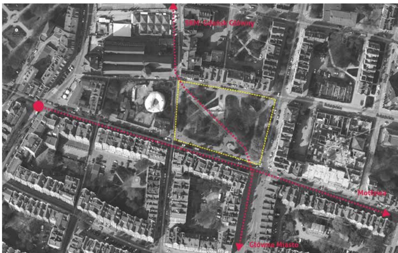
Ciągi komunikacji pieszej

Trzecim istotnym generatorem ruchu jest Kościół Św. Mikołaja, który w niedzielę przyciąga sporą ilość użyt-