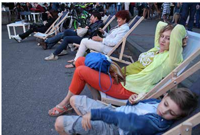
Koncert Jazzowy w Parku Świętopelka