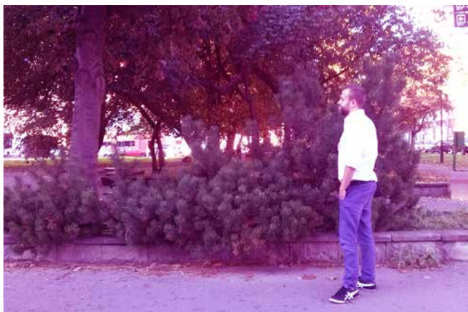
Zieleń niska oddziela widokowo park, widok od strony ul. Szerokiej.

W ramach działań wstępnych, poprawiających obecne ukształtowanie parku i jego sposób użytkowania postulowane jest przycięcie zieleni wysokiej. Nie oznacza to wycinki drzew, a jedynie kosmetyczne przycięcie gałęzi na wysokości wzroku użytkownika, do wysokości 3 metrów. Niemniej ze względów estetycznych, wymagane jest wycięcie lub przynajmniej ograniczenie liczby drzew owocowych w parku. Są one zlokalizowane przypadkowo i w większości są dziko rosnące – co obniża walory estetyczne parku. Drzewa te dodatkowo brudzą nawierzchnie ciągów pieszych owocami i sprawiają, że rejon w którym są zlokalizowane wygląda odpychająco.