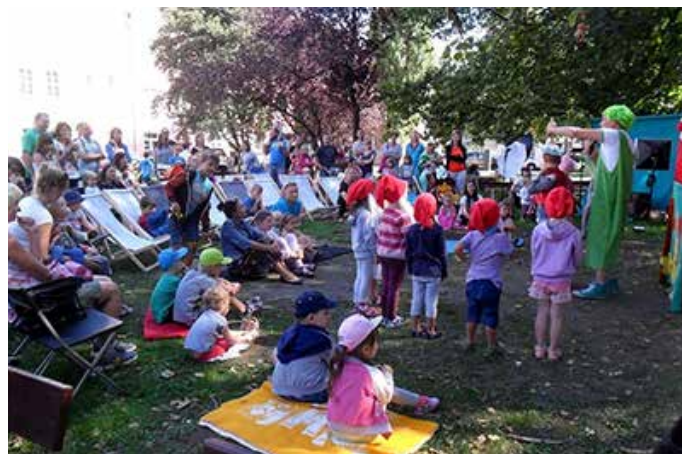
Teatrzyk dla Dzieci w Parku Świętopelka