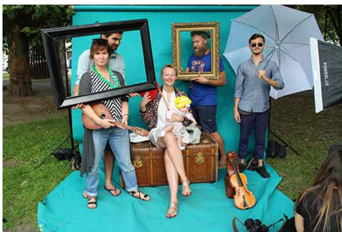
Fotograficzne Atelier w Parku Świętopelka

Istotnym elementem kształtowania miejsca jest aktywizacja dzieci.