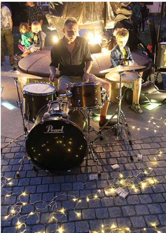
Koncert Jazzowy w Parku Świętopelka

Istotnym elementem kształtowania miejsca jest aktywizacja dzieci.