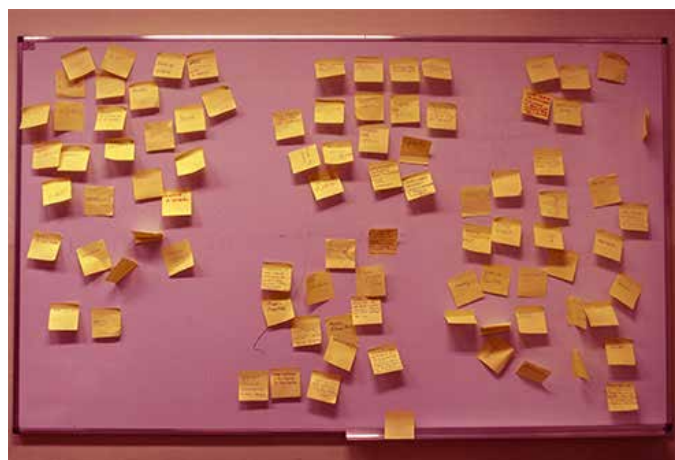
Jedno z ćwiczeń podczas konsultacji.

W trakcie konsultacji odbyło się 8 spotkań z mieszkańcami miasta, przedstawicielami Rady miasta Gdańska i Rady Dzielnicy Śródmieście; równoległe do nich spotykaliśmy się z przedstawicielami jednostek miejskich, jak Zarząd Dróg i Zieleni, czy Miejski Konserwator Zabytków. Wszyscy oni byli istotnymi aktorami w procesie negocjacji przyszłego wizerunku Parku Świętopętka.