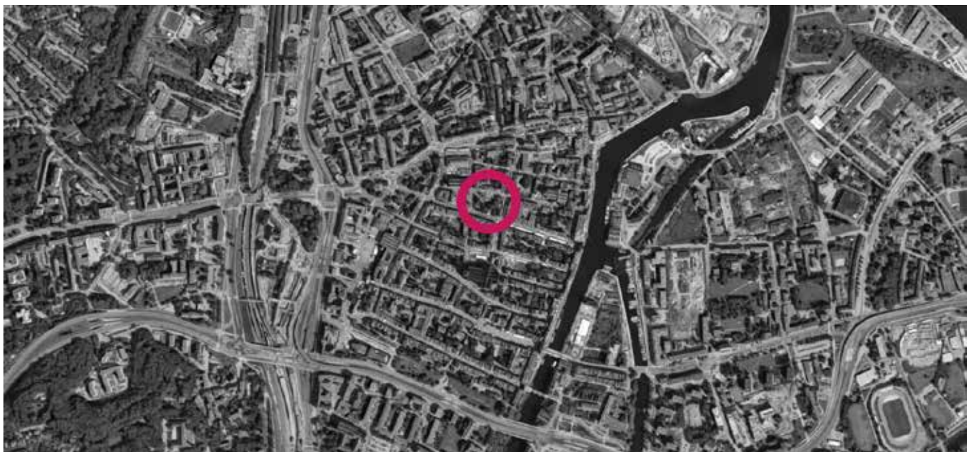
Lokalizacja skweru - centrum Śródmieścia Gdańska

pieczne wejście na trawę i lekko poprawiły wizerunek parku. Jednocześnie w miejscu tym stowarzyszenie zorganizowało serię wydarzeń miejskich, by zainteresować mieszkańców tym miejscem i zarazem sprawdzić jak ono funkcjonuje.