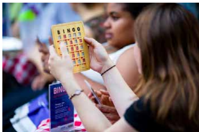
Bingo w Bryant Park

Inną propozycją, spośród dziesiątek jest np.: turniej bingo.