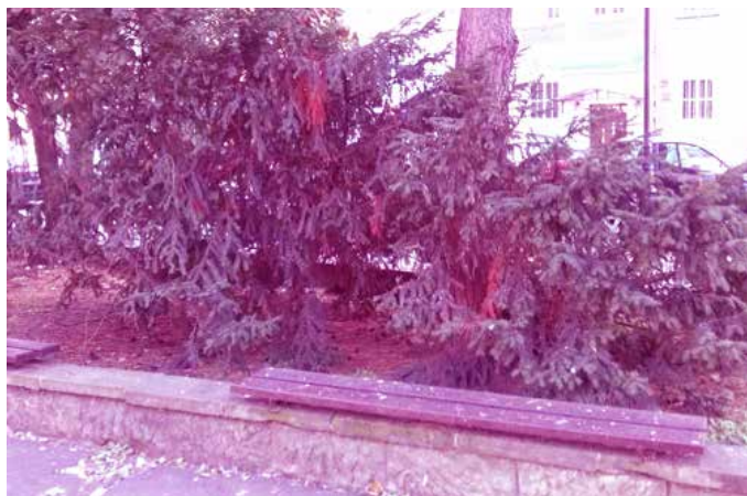
Istniejące niskie drzewa generują miejsce ciemne, skłaniające go spożywania alkoholu i wyrzucania śmieci

psychologicznych kształtujących poczucie bezpieczeństwa i komfortu w przestrzeni publicznej.