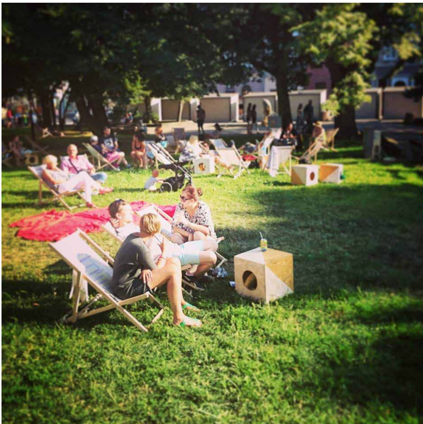
Piknik w Parku Świętopełka, 2014

Mobilne miejsca siedzące dają swobodę użytkownika oraz poczucie za-domowienia w przestrzeni.